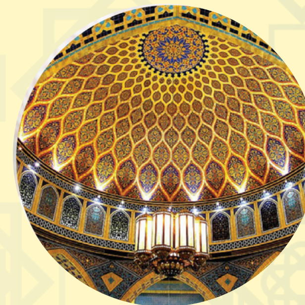
Islamic Art & Design