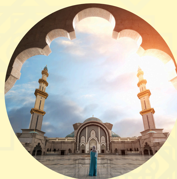
Islamic astronomy & Muslim Friendly Travel